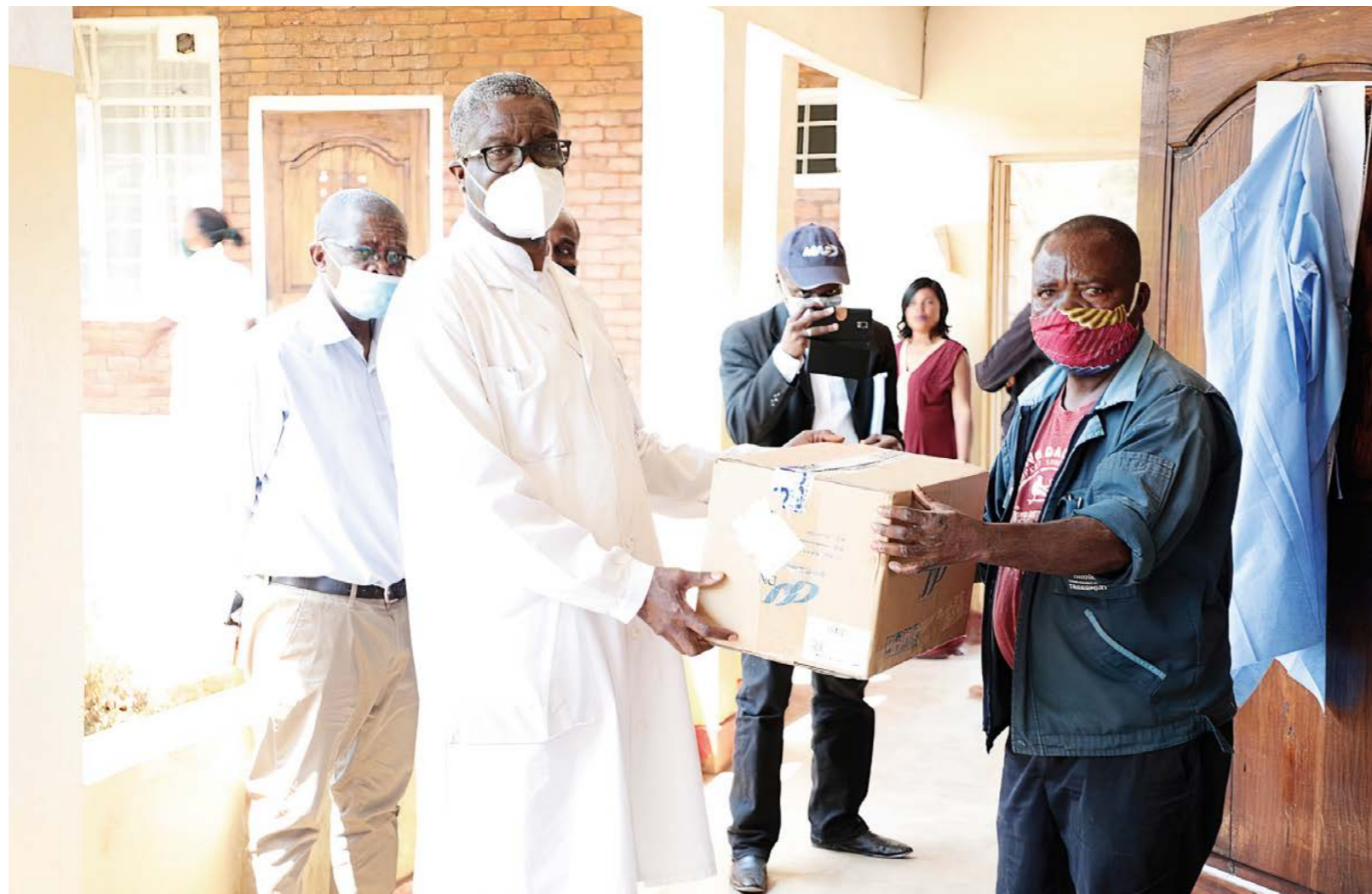
Doktor Mukwege tar emot covidtesterna när de anländer till Panzsjukhuset i Bukavu.